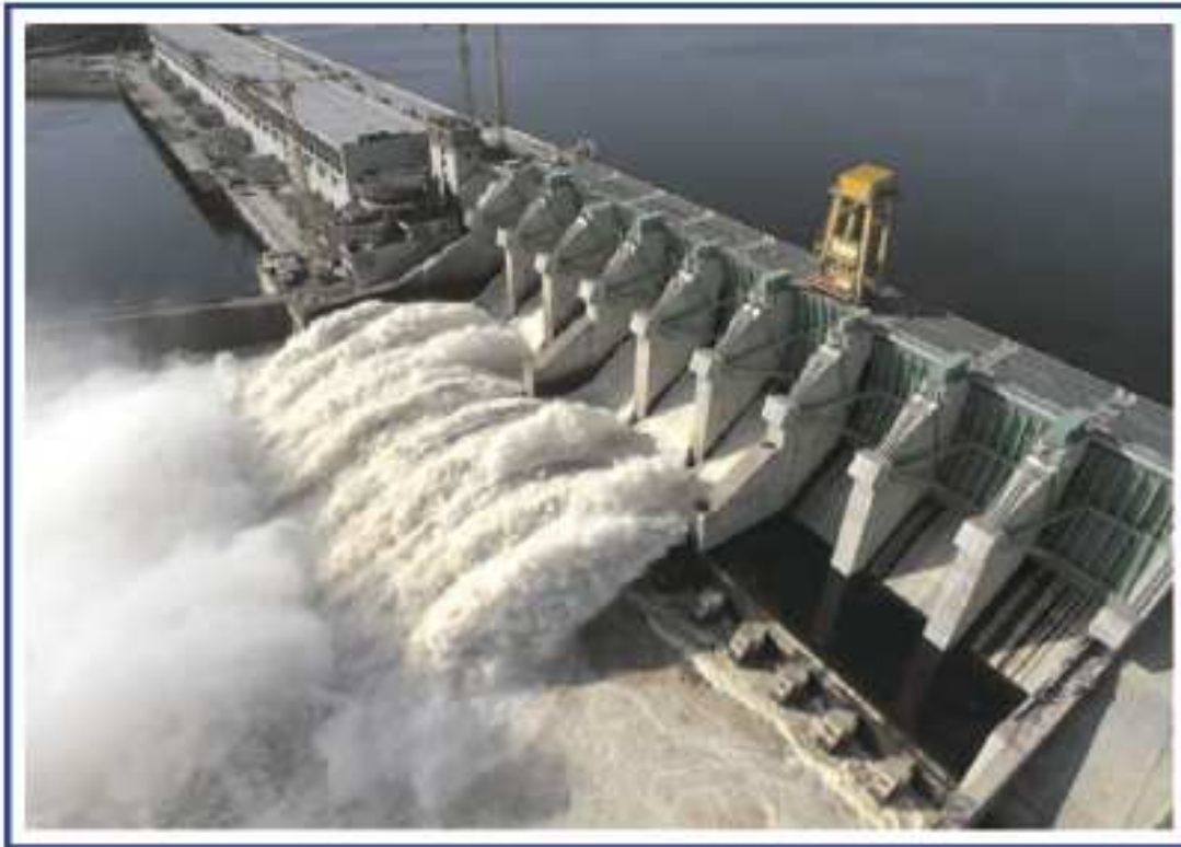
تهران - اردیبهشت ماه ۱۳۸۹